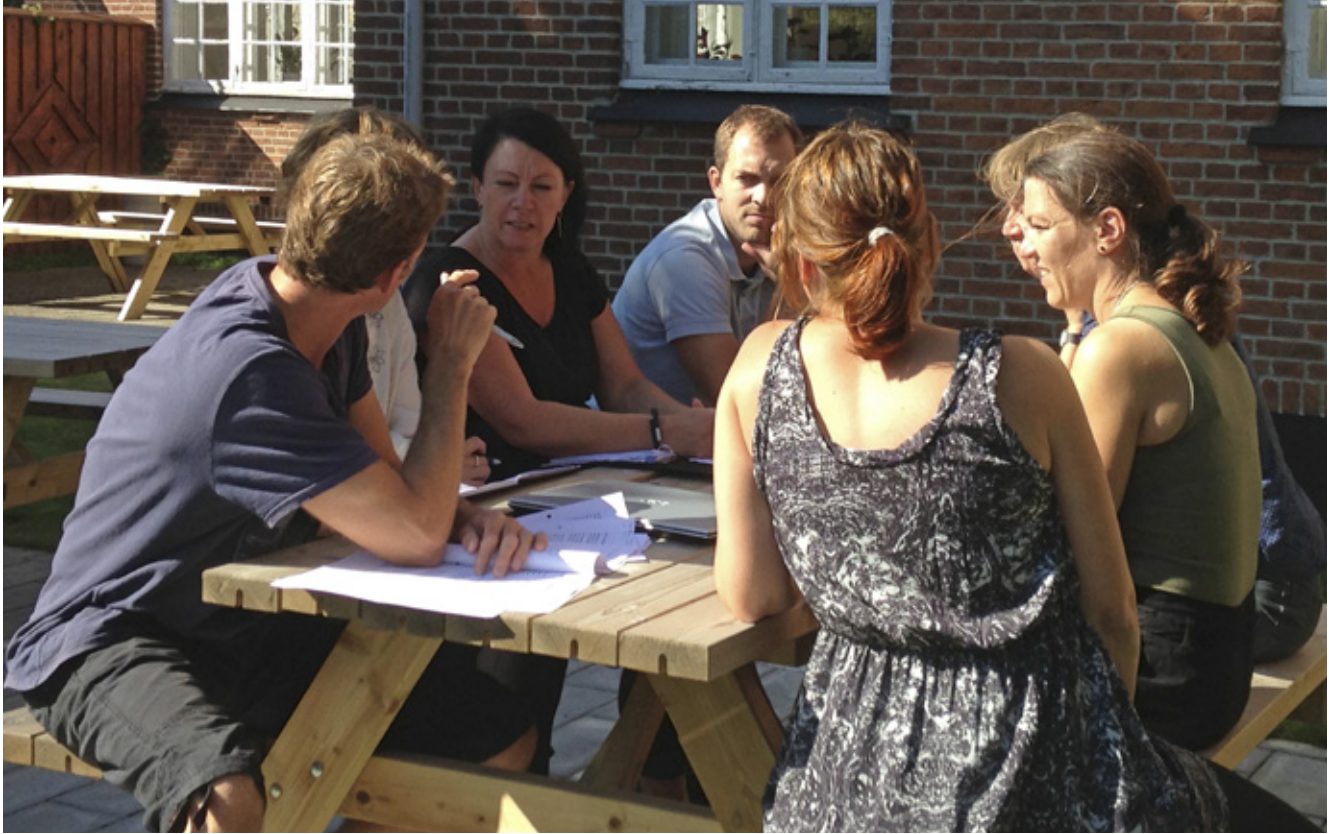
Lærere og skoleledere drøfter værdier. Borgen 2014.

ning af det moderne liv, inddrages naturligvis også andre pædagogiske tænkere og ideer, der kan virke frugtbar ind på det nutidige skolearbejde og medvirke til forståelse af nye virkelighedsopfattelser og formidlingsformer.