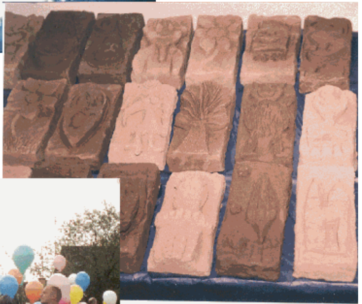
Elevernes gave til skolen