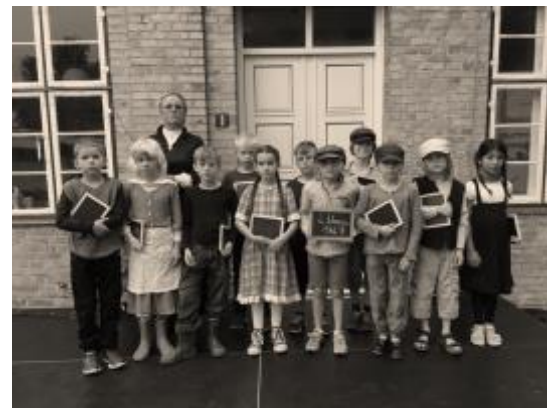
2. klasse er klar til teater

Jeg håber, I alle har fået vores pjese 'Ollerup Friskole 2017/18' med kalender og beskrivelse af de arrangementer vi afholder i dette skoleår.